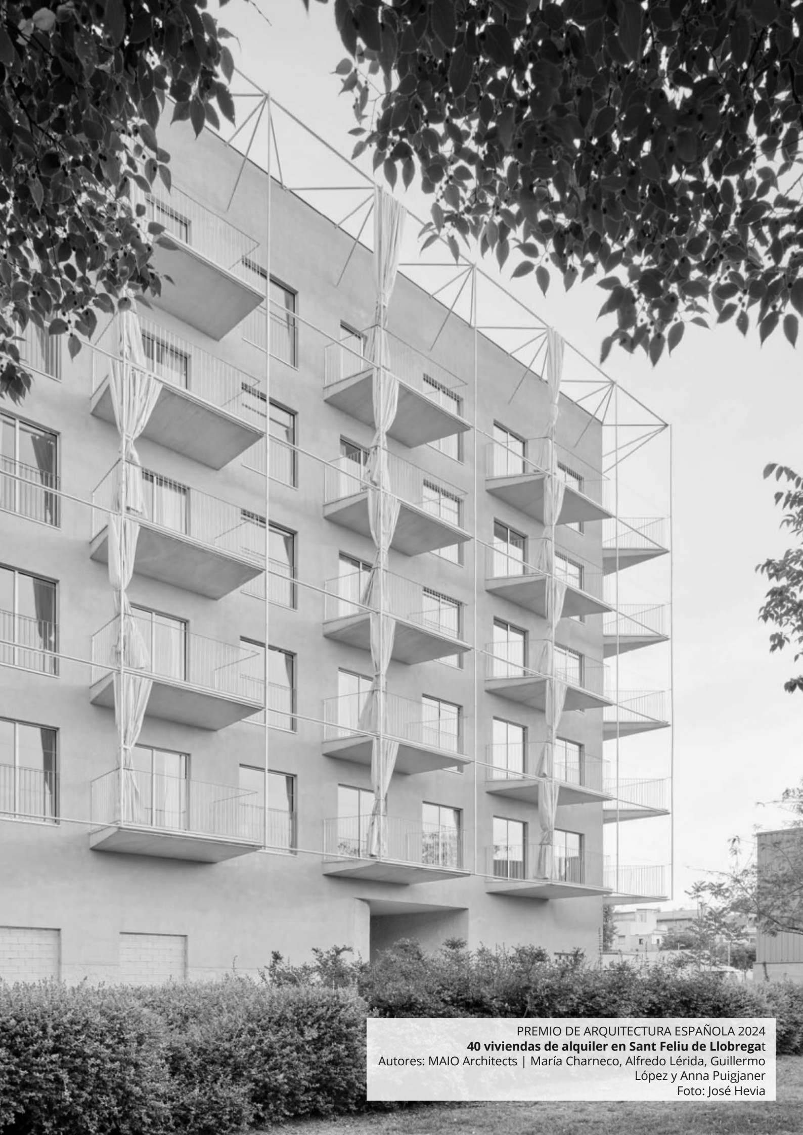
PREMIO DE ARQUITECTURA ESPAÑOLA 2024 40 viviendas de alquiler en Sant Feliu de Llobregat Autores: MAIO Architects | María Charneco, Alfredo Lérica, Guillermo López y Anna Puigjaner