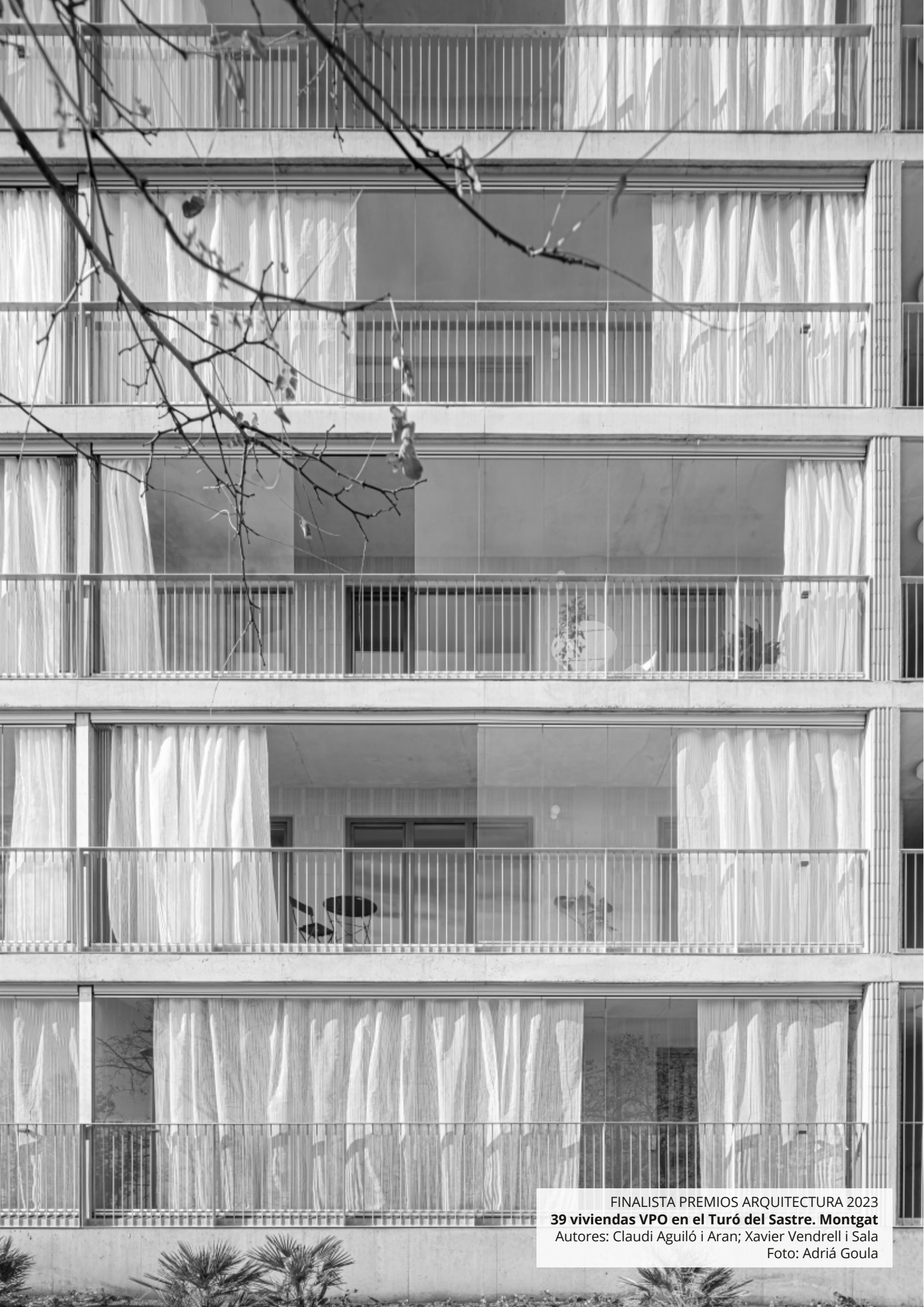
FINALISTA PREMIOS ARQUITECTURA 2023 39 viviendas VPO en el Turó del Sastre. Montgat Autores: Claudi Aguiló i Aran; Xavier Vendrell i Sala