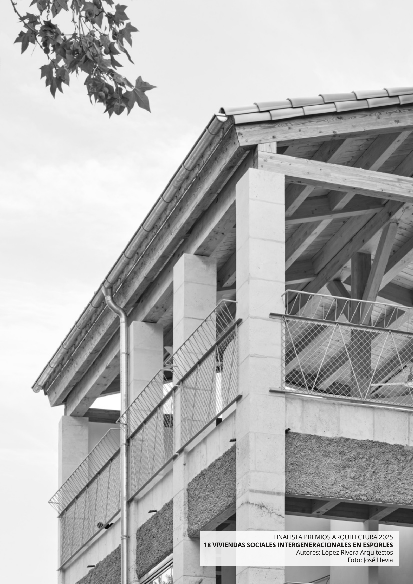
FINALISTA PREMIOS ARQUITECTURA 2025 18 VIVIENDAS SOCIALES INTERGENERACIONALES EN ESPORLES Autores: López Rivera Arquitectos