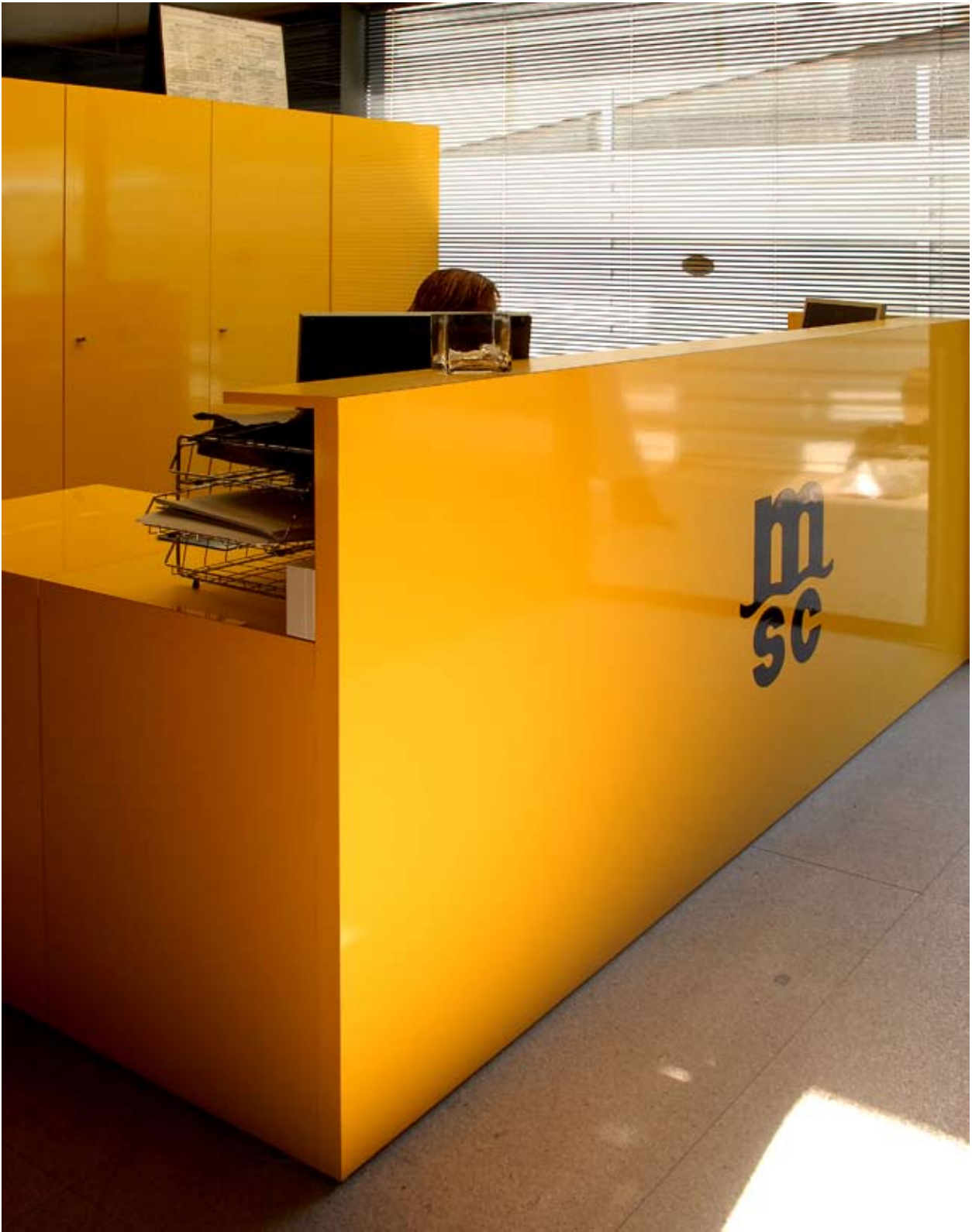
Sede MSC Laminite