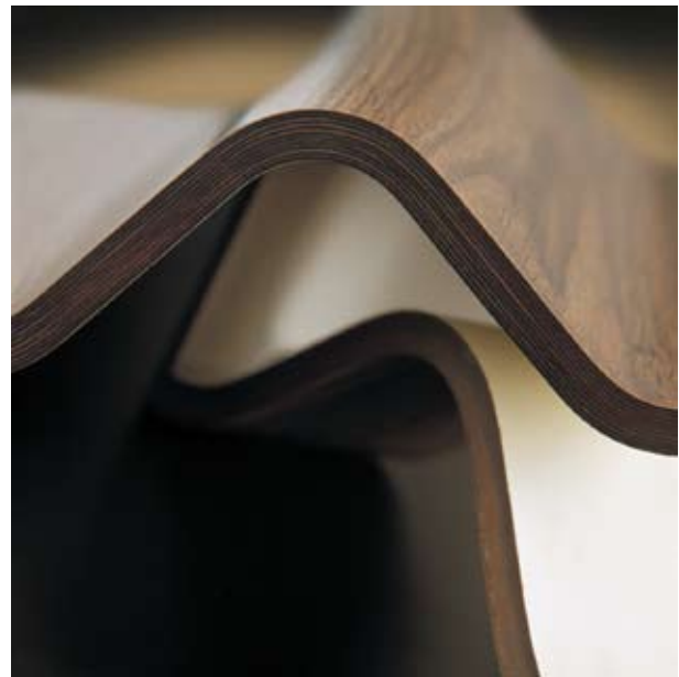
Tablero contrachapado de alta densidad

Algunos de los tableros compuestos y de los tableros HPL utilizados en la construcción pueden estar afectados por la Directiva Europea de Productos de la Construcción, por lo que deberán llevar el Marcado CE. La implantación de la Directiva se realizará con la norma armonizada EN 438-7 que define todos los aspectos relativos al mercado CE.