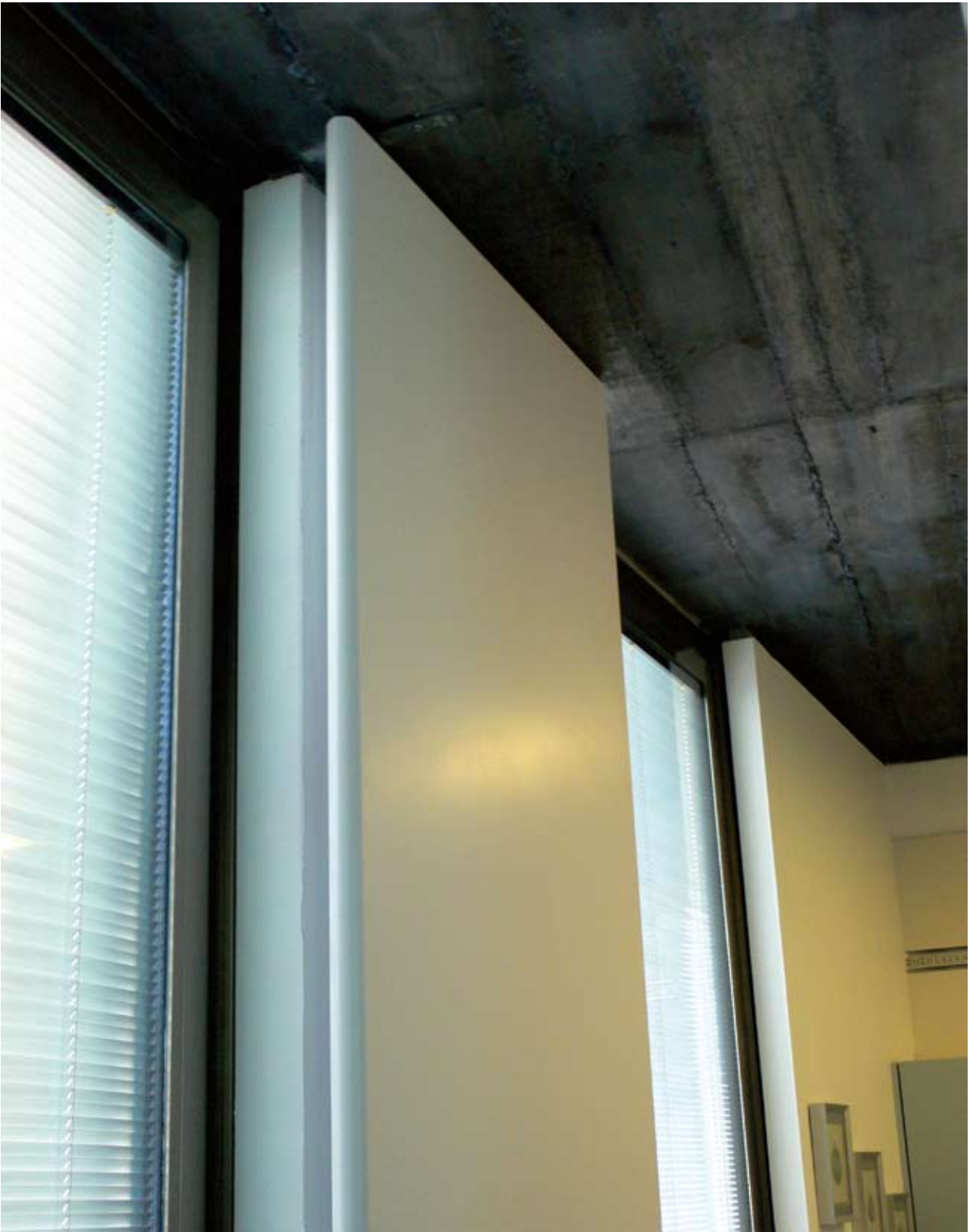
Puerta de MDF lacada. Vivienda en Santa Cruz de Tenerife. Arquitectos: AMP Arquitectos